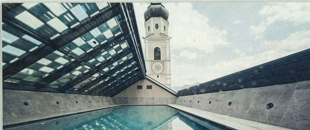
HOTEL LAMM ★★★★★